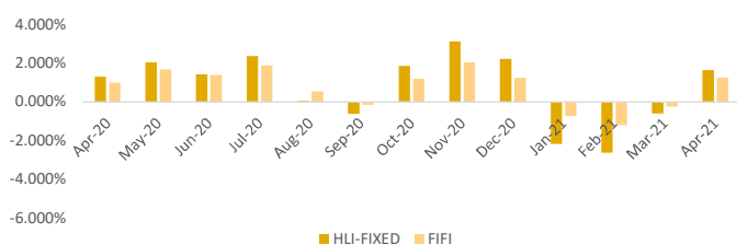
Return Bulanan HLI-Fixed vs Benchmark-FIFI